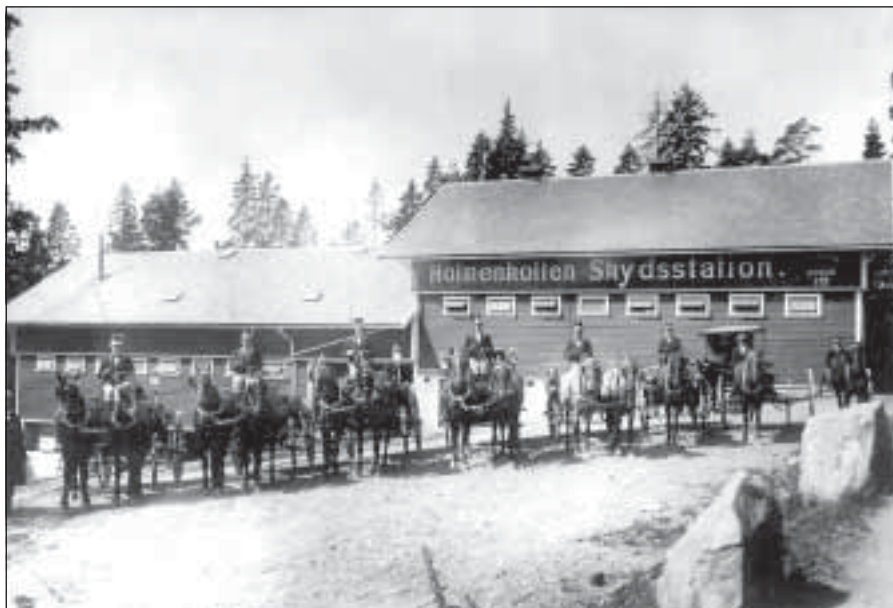
Holmenkollen Skydsstation.