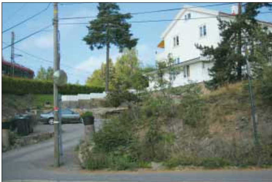
Innkjørselen fra Holmenkollveien. Frognersesterbanen til venstre.