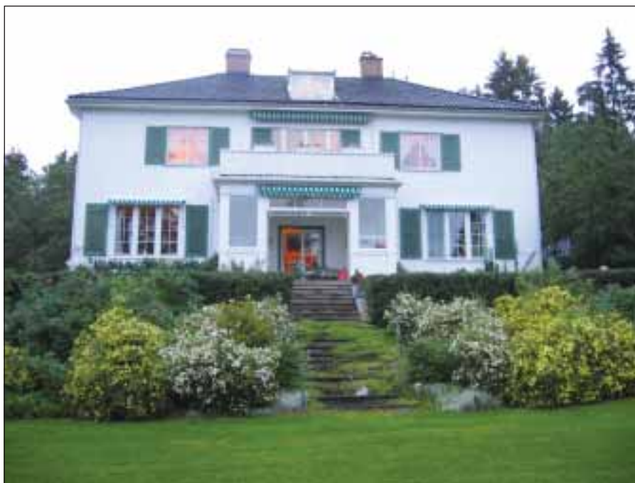
Holmenveien 35 den gang som i dag.

Skjønsberg formidlet økonomisk støtte til Hjemmefronten gjennom sitt arbeid og medeierskap i bankierfirmaet Faye-Schjøll. En dag kom Halvorsen opp på Skjønsbergs kontor og ba om penger. Det endte med at han fikk 10.000 kroner til sitt hjelpearbeid. Halvorsen sammenkalte