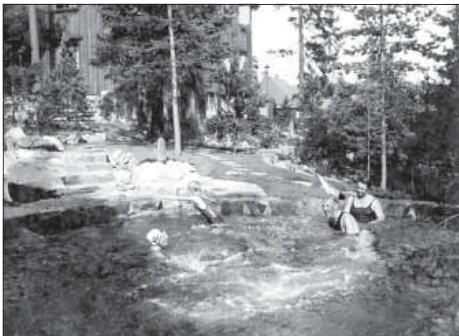
Badedammen i Dr. Holms vei.

Svart-hvittbildene er fra familiealbumet og fra bladet "Urd".