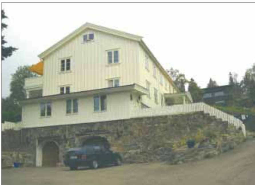
Holmenkollveien 104 med den opprinnelige grunnmuren.