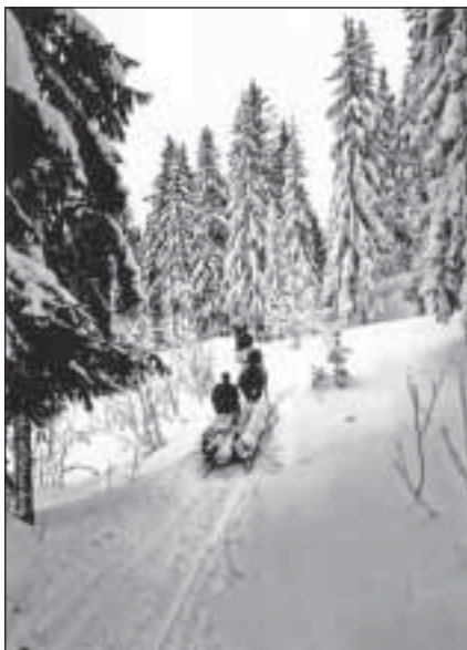
Skogsdriften slik vi husker den. Fra boken.

Boken anbefales på det varmeste og blir gjenstand for en utførligere omtale i et senere nummer av bladet. Da vil flere sider av innholdet bli omtalt, kampen om vannet og om Osloomarka, skogens menn og moderniseringen av skogsdriften.