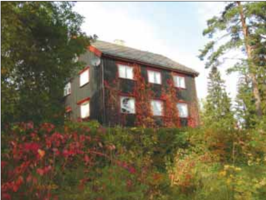
Dr. Holms vei 17 i dag.

Solør som bodde i kjelleren. Han hjalp med diverse arbeid både hos oss og hos flere naboer. Blant annet hjalp han far med å fjerne alle buskvekster og løvtrær på eiendommer. Det ble gjort ved å fjerne barken nederst på stammene slik at busker og småtrær døde. Året etter var det enkelt å fjerne restene. Vi fikk derved en veldig fin åpen skogbunn med en mengde blåbær og tyttebær. Øverst på eiendommer ble det bygget et utsiktstårn, med stige opp til en plattform hvor man kunne ligge usjenert og sole seg, og i tillegg en fabelaktig utsikt.